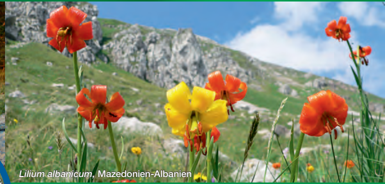
Lilium albanicum, Mazedonien-Albanien

Das Grüne Band Europa gliedert sich in vier Hauptregionen: Fennoskandien, Ostsee, Zentraleuropa und Balkan. Eine Lenkungsgruppe bestehend aus Vertretern aller Regionen ist für die Gesamtkoordination verantwortlich. Jede Sektion wird von einem Regionalkoordinator betreut und in jedem Land gibt es nationale Ansprechpartner.