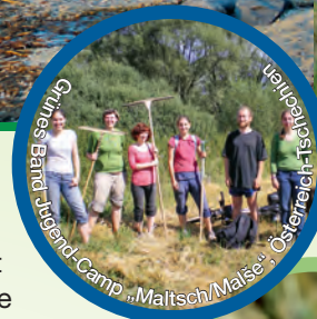
Grünes Band Jugend-Camp „Maltsch/Maise“ Österreich

Der zentraleuropäische Abschnitt durchzieht eine Vielzahl an Kulturlandschaften, die teilweise intensiv landwirtschaftlich genutzt werden. Das Grüne Band läuft entlang der ehemaligen inner-deutschen Grenze, durchzieht das Böhmisches Massiv mit seinen ausgedehnten Wäldern wie den Nationalparken Bayerischer Wald/Šumava und folgt naturnahen Flüssen wie Mur und Drau. Entlang der Gebirgskämme der Karavanken und Julischen Voralpen verläuft es bis zur Adria. Mit Unterstützung der Anrainerstaaten und durch finanzielle Förderung der EU, konnten zwei transnationale Projekte verwirklicht werden. Die Hauptziele sind Schutz des Grünen Bandes als ökologischer Korridor und Erinnerungslandschaft, Entwicklung grenzüberschreitender Zusammenarbeit und Förderung nachhaltiger Regionalentwicklung.