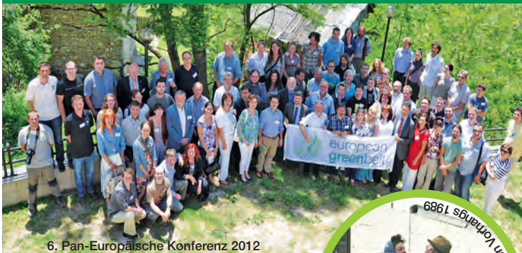
6. Pan-Europäische Konferenz 2012